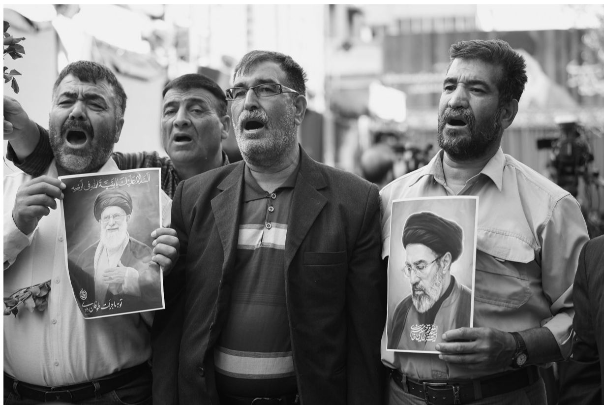
5月7日下午，大批民众在德黑兰集会，悼念已故最高领袖哈梅内伊，誓言效忠现任最高领袖穆塔巴·哈梅内伊。图为民众在伊朗首都德黑兰手持已故和现任最高领袖画像参加集会。