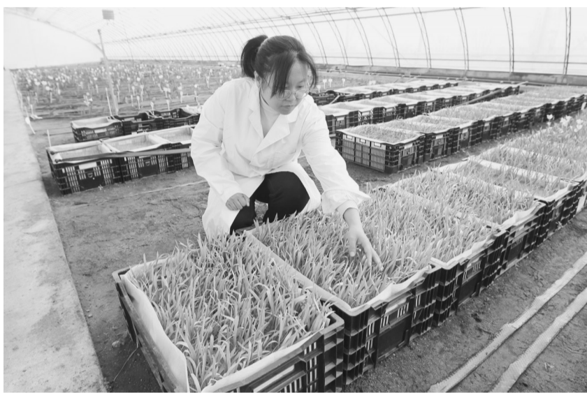
经过太空遨游的郁金香种子苗儿茁壮。图为科研工作者正在查看苗情。