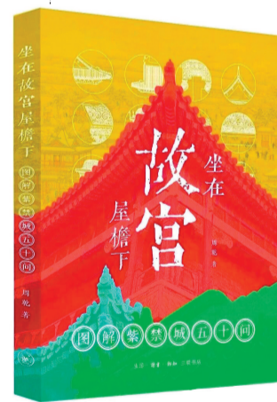
《坐在故宫屋檐下》 生活·读书·新知三联书店

这是一本特别好玩的故宫读物。太和殿广场为何一棵树不种？屋顶小兽队伍里怎么混进个“人”……故宫博物院研究员周乾解读有600年秘密的紫禁城。在这本书中，他用50个历史生活、皇家秘辛的故宫趣味问答，一次解答你所有想问又不好意思问的“故宫那些事儿”。