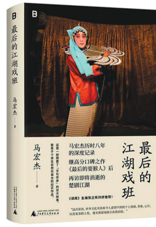
《最后的江湖戏班》 广西师范大学出版社

这是一本特别好玩的故宫读物。太和殿广场为何一棵树不种？屋顶小兽队伍里怎么混进个“人”……故宫博物院研究员周乾解读有600年秘密的紫禁城。在这本书中，他用50个历史生活、皇家秘辛的故宫趣味问答，一次解答你所有想问又不好意思问的“故宫那些事儿”。