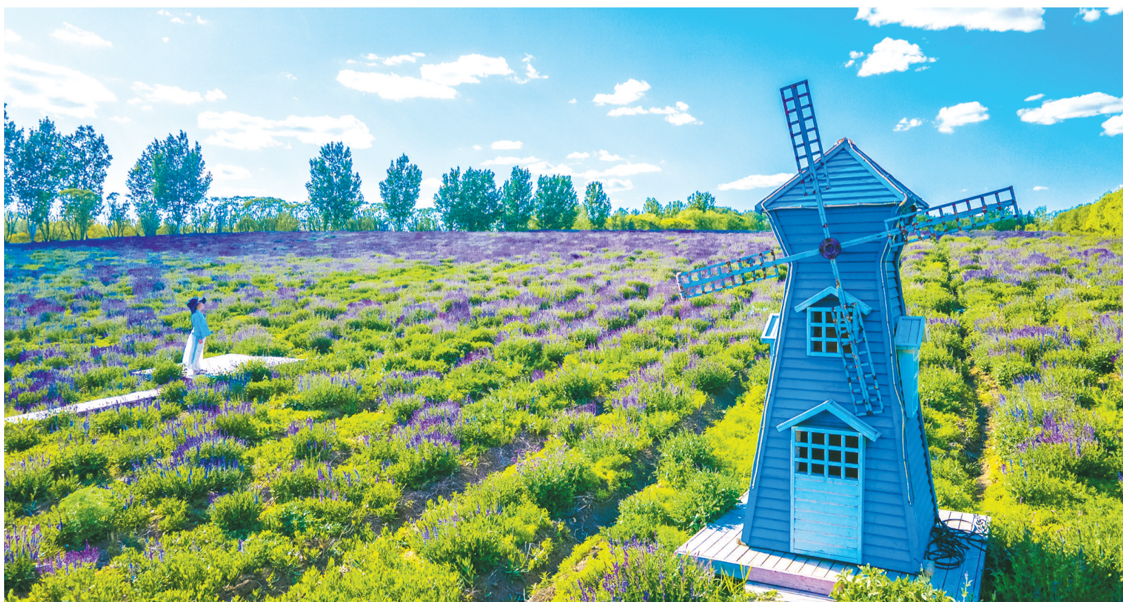
黄家沟村在工业旧址上改造重生，建成了集休闲游乐、田园度假于一体的旅游度假区，成为城市周边人气十足的文旅新地标。