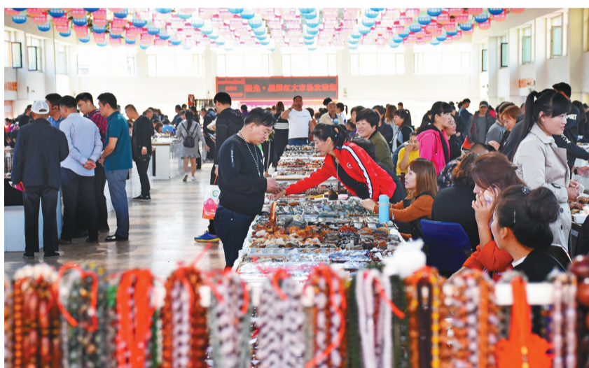
十家子玛瑙特色小镇是国家级玛瑙特色小镇，为全国最大玛瑙加工地和交易集散地。“五一”期间大集天天开放，可淘玛瑙宝贝。