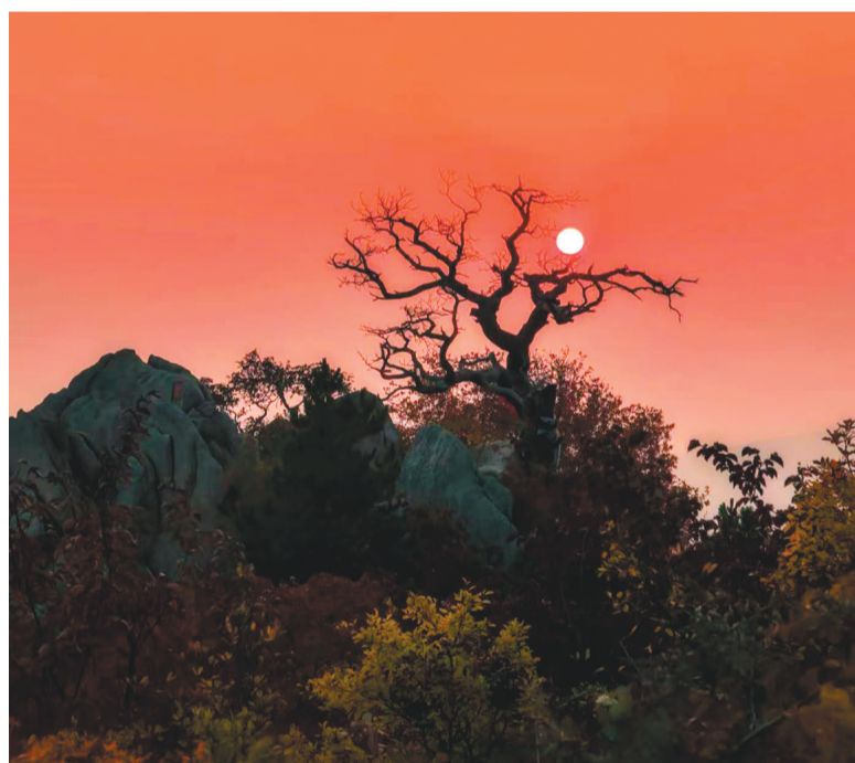
海棠山风景区被誉为“中国北方文化名山”，“五一”期间可登山、赏花、观演。

这个“五一”，阜新的重点景区及文旅街区完成了“场景化”升级。推出近郊踏青休闲游、亲子趣玩研学游、生态康养度假游、玛瑙文化购物游4条主题精品旅游线路，30余场文旅体商特色活动轮番登场，打造内容丰富、形式多样的春日文旅盛宴。在融融春色里，邂逅这座兼具历史底蕴、生态之美与蓬勃活力的阜新，收藏一段温柔又难忘的春日旅程。