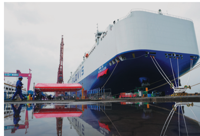
4月28日，一名工作人员从刚交付的运输船旁走过。

28日，由我国造船企业自主建造的全球最大汽车运输船在广州南沙交付。该船最大装车量达10800辆，刷新全球同类船舶运力纪录，标志着我国高端船舶制造能力实现新突破，为全球航运业绿色低碳转型提供了“中国方案”。