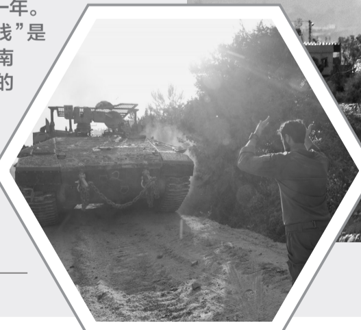
左图：集结在以黎边界以色列一侧的以军部队。右图：4月26日，黎巴嫩南部一处遭到空袭的地点升起浓烟。

“前沿防线”是以军在黎巴嫩南部单方面划设的一条军事控制线，线南为以方占领的缓冲区、即所谓“安全区”。