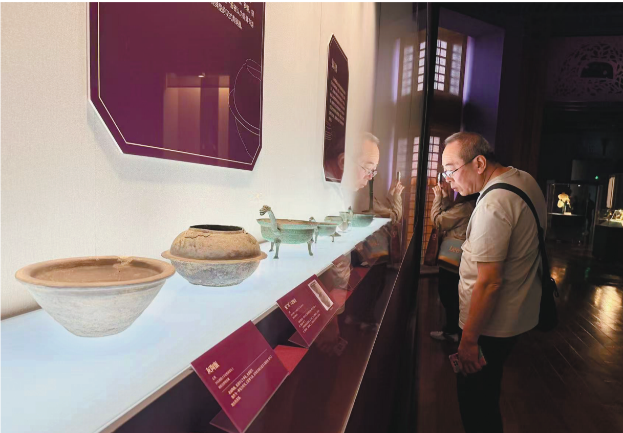
来自辽宁的“来处与归途:三燕百年”展,每天吸引不少深圳观众前来参观。

对于两地观众而言,这场合作带来实实在在的福利。辽宁观众不用远赴岭南,就能近距离品读南方匾额文化、客家民俗风情;深圳市民