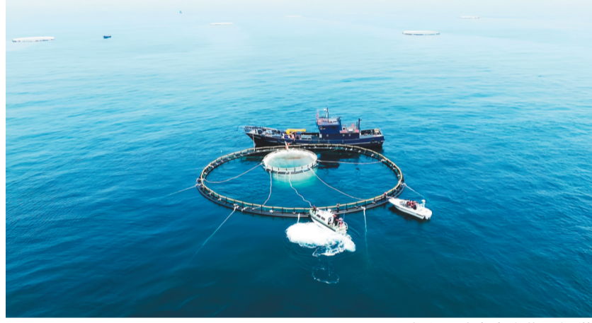
丹东东港现代化海洋牧场项目4.0。