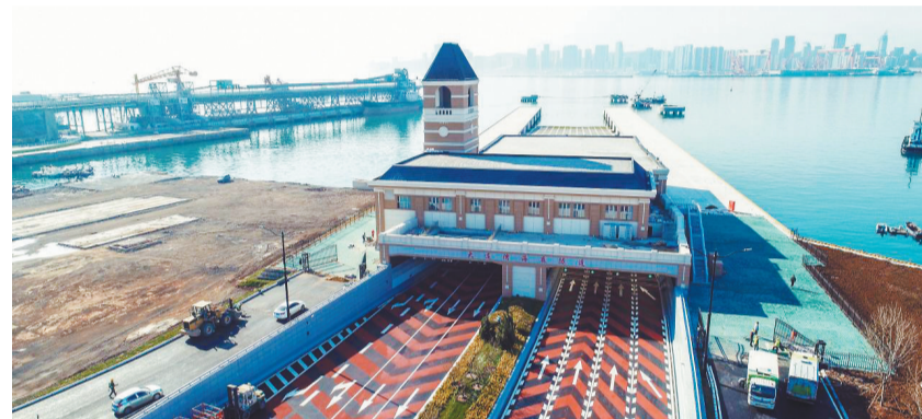
大连湾海底隧道和光明路延伸工程。

沈大高速车流如织，渤海湾畔巨轮穿梭。高效畅通的交通网络，成为辽宁重振雄风、再创辉煌的强劲引擎。近年来，辽宁紧紧围绕国家重大战略导向，积极融入京津冀协同发展、共建“一带一路”，打造面向东北亚的综合交通门户枢纽，加快建设“通道+枢纽+网络”的现代综合立体交通体系。中交集团深度服务辽宁“双核两轴三环六通道”综合立体交通网主骨架，聚焦全交通领域主责主业，充分发挥国家交通建设主力军优势，统筹推进重大交通项目全生命周期管理，全力提升辽宁交通网络的覆盖广度、通达深度和连接速度。阳春三月，由中国交建牵头，中交路建、中交一公局集团、中交一航局参与投资建设的秦皇岛至沈阳高速公路（松岭门至沈阳段）正加速推进，这条全长238公里的高速是东北地区高速公路网扩容升级的关键工程，作为新增的东北入关通道，建成后有效缓解京哈高速通行压力，优化辽西路网格局，支撑辽宁“一圈一带三区”发展，强化京哈走廊应急保通能力。