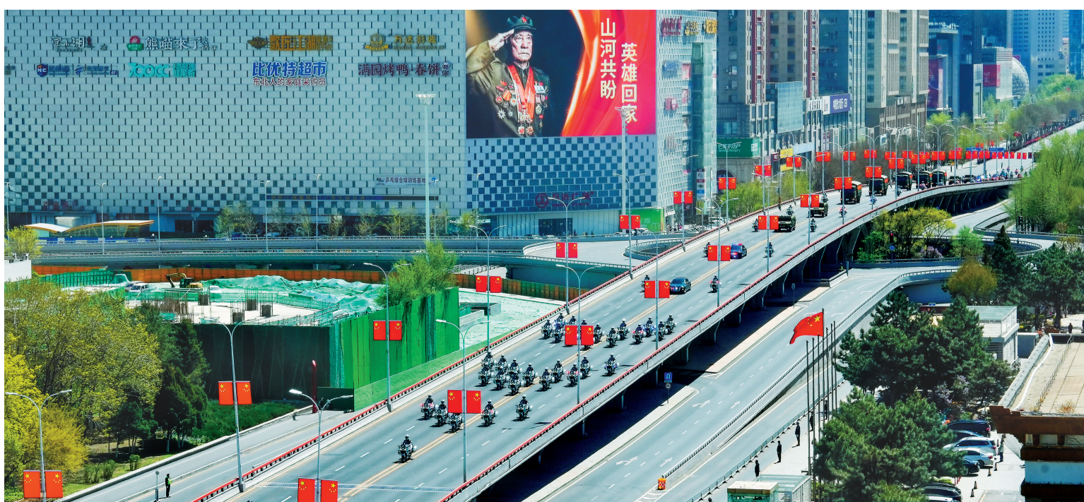
图①：运-20B滑行通过“水门”。 图②：礼兵将烈士棺槨安放至摆放区。 图③：礼兵手捧烈士棺槨走下运-20B。 图④：各界群众迎接忠魂还乡。 图⑤：迎回仪式现场。 图⑥：烈士遗骸安葬仪式举行。 图⑦：邓仕均烈士之子邓其平在英名墙前缅怀父亲。 图⑧：护送烈士棺槨的车队驶过青年大街。 本报记者 徐丹伟 查金辉 赵敬东 白琳 摄 邹新江 摄