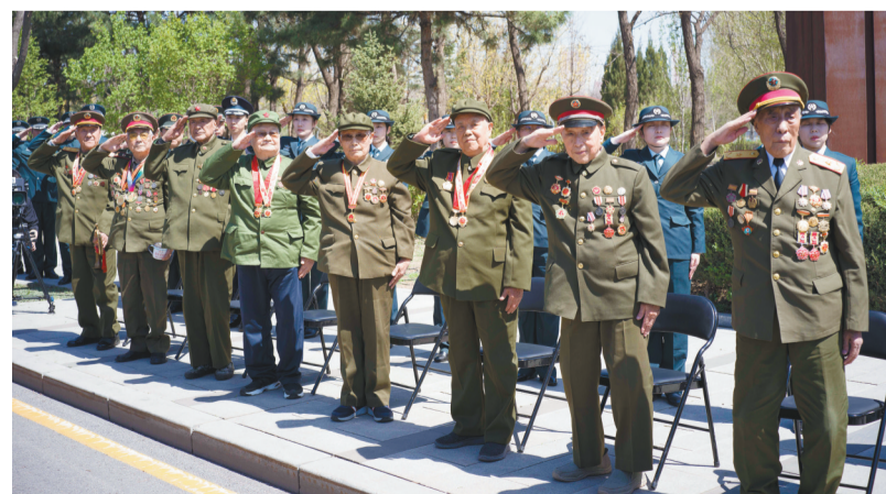
老战士向归来的战友敬礼。

了让父亲“看”到回家的战友。英雄的战友和家属来了,神舟二十号航天员乘组、奥运健儿、港澳台师生、青少年学生代表……从全国各地赶来的人们齐聚沈阳,接英雄回家!青年大街两侧,民众自发排成长队,一眼望不到头。人群中,有手握白菊花的孩童,有鬓发如雪的老人,