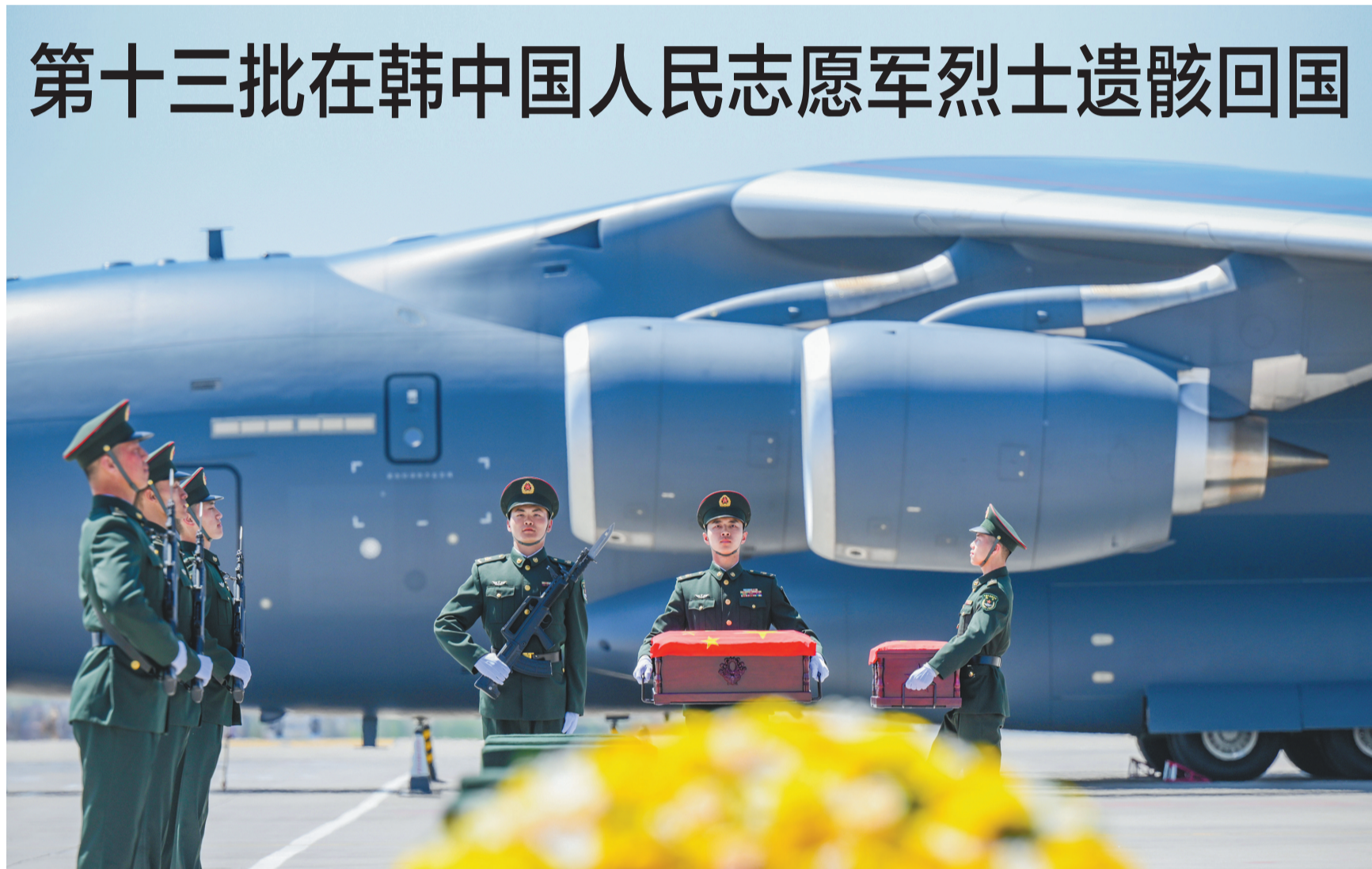
4月22日,沈阳桃仙国际机场,礼兵将志愿军烈士遗骸棺槨从专机护送致棺槨摆放区。