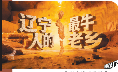
阜新查海石堆塑龙