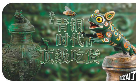
卷体夔纹蟠龙盖罍

“国宝AI了”系列短视频以“科技赋能文物活化”为核心，融合人工智能与实景拍摄，成功实现破圈传播。技术上，借助人工智能技术搭建沉浸式体验场景；创意上，精心设计专属外框，搭配趣味内容营造裸眼3D效果，让沉睡的国宝真正“活”起来，让厚重的历史文化走进大众生活。