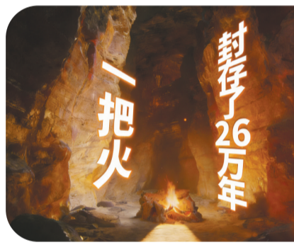
金牛山人封火灶址

“国宝AI了”系列短视频以“科技赋能文物活化”为核心，融合人工智能与实景拍摄，成功实现破圈传播。技术上，借助人工智能技术搭建沉浸式体验场景；创意上，精心设计专属外框，搭配趣味内容营造裸眼3D效果，让沉睡的国宝真正“活”起来，让厚重的历史文化走进大众生活。