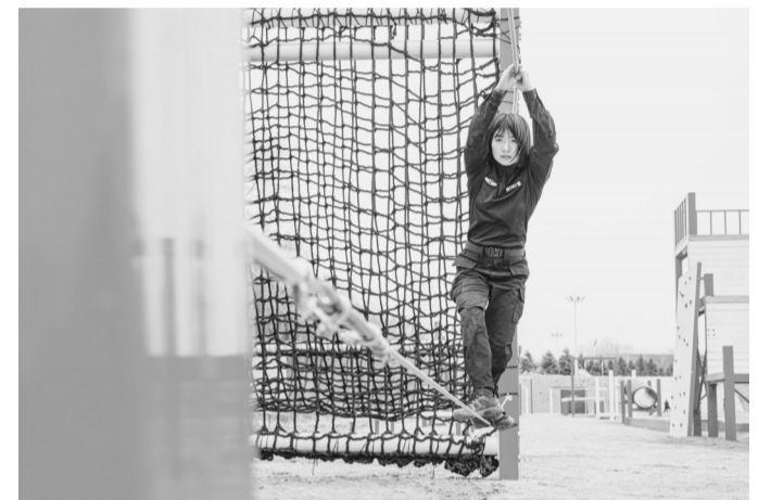
连日来，沈阳铁路公安扎实开展特警实战练兵活动，全力锻造铁路公安尖兵。此次练兵全方位锤炼队员的实战能力，为铁路运输安全和旅客出行平安筑牢坚实防线。