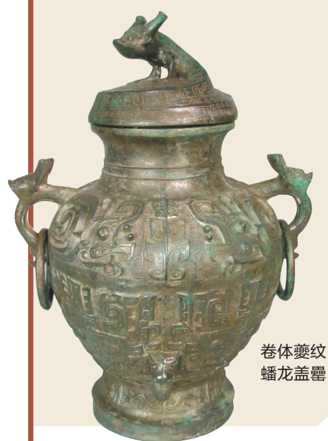
卷体夔纹蟠龙盖甗