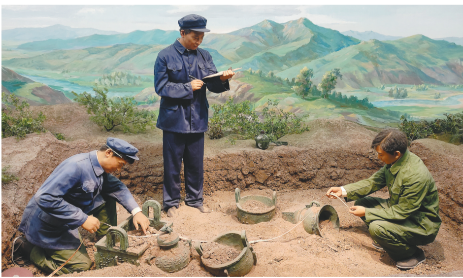
省博物馆展出的喀左北洞窖藏考古发掘现场场景模型。

辽西周青铜窖藏的发现,像一束光,照亮了东北青铜文明研究的空白。它推动学术界重新审视东北古代文明的分量。一件件确凿的考古实物,实证了辽宁在中华文明多元一体形成中的关键地位,也记录了东北大地与中原血脉相连、文化共生的悠久历史。