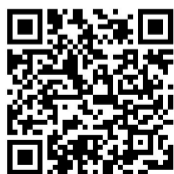
更多精彩内容 扫码观看

回忆道，眼里闪光，一个是技艺与市场的巅峰，一个是资源与历史的富矿。一场跨越千里的奔赴，就此注定。