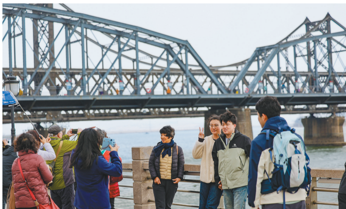
图为清明假期,丹东市鸭绿江畔游人如织。

在锦州市,“春登青岩,福佑常兴”活动凭借清幽环境与福韵文化,吸引游客登高纳福。营口市举办“赶大集,寻春趣”活动,高跷舞蹈、东北大鼓、民俗演艺