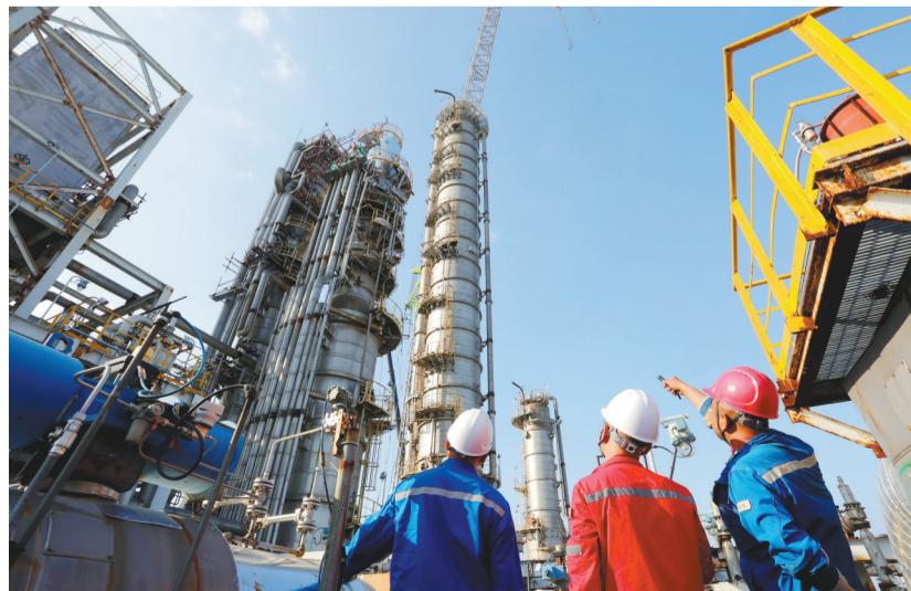
图为抚顺石化公司项目施工现场。

眼下,抚顺石化公司年产80万吨乙烯装置瓶颈改造及能效提升项目和重整加氢装置炼油结构优化项目正