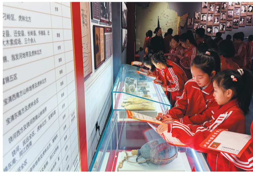
清明节前夕,本溪市实验小学教育集团少先队员来到东北抗联史实陈列馆重温英雄故事,传承红色基因。

本报讯 记者王月报道 清明节前夕,全省各界人士纷纷前往烈士陵园、红色场馆等地,以多种形式开展清明祭英烈活动,缅怀英雄先辈、弘扬伟大精神、传承红色基因。一场场庄重仪式、一次次深情缅怀,激励大家在回望历史中汲取奋进力量,把对先烈的缅怀转化为爱国情、强国志、报国行。雨后初晴,沈阳抗美援朝烈士陵园气氛庄严肃穆。杨根思、黄继光、邱少云……看到墓碑上英雄的名字,