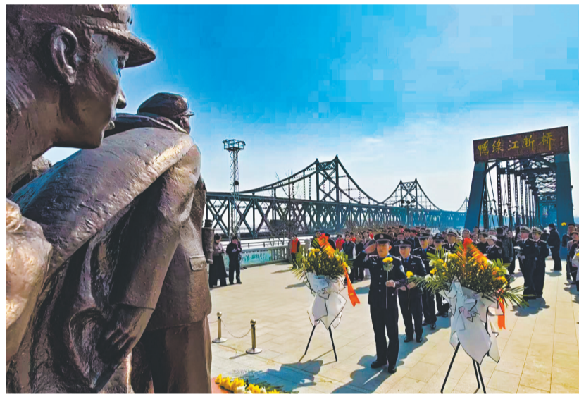
清明节前夕,丹东举办“缅怀抗美援朝英烈 传承红色奋进精神”主题活动,当地各界人士以庄重仪式缅怀革命先烈。