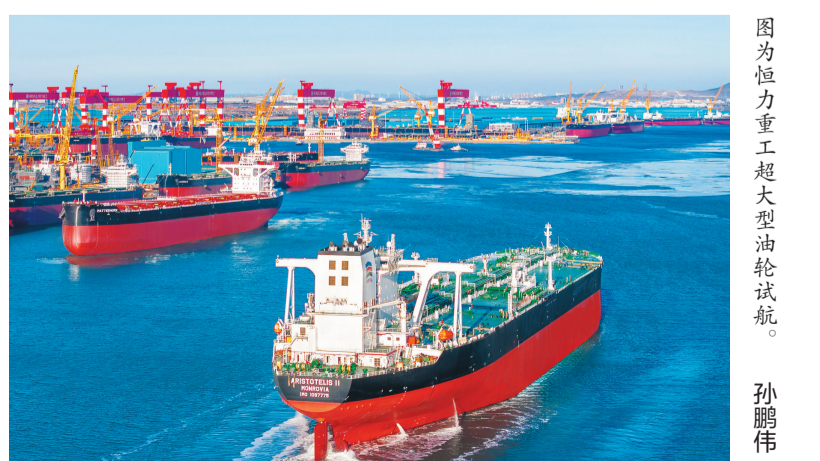
图为恒力重工超大型油轮试航。