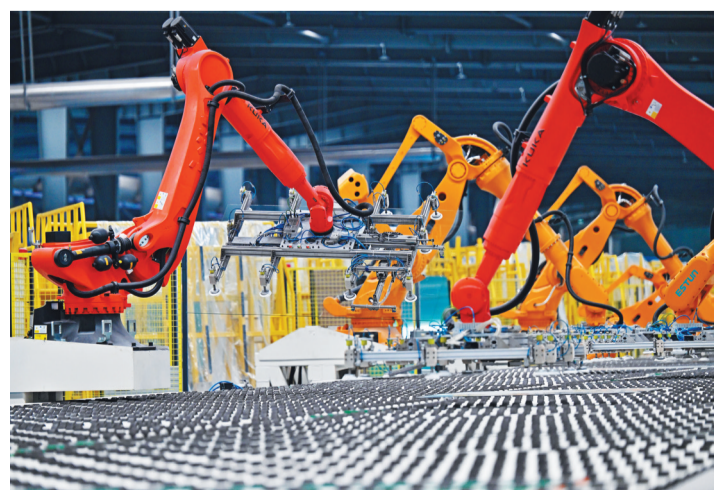
图为本溪玉晶玻璃有限公司一密三线生产线。

在辽宁花翎新材料有限公司气凝胶新材料项目一期建设现场,机器轰鸣声响彻天际,混凝土泵车高扬