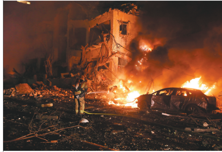
以色列应急救援人员在特拉维夫一处遭袭现场开展工作。

3月29日，美国和以色列对伊朗发动武力袭击进入第30天。一个月里，战火波及多国，影响持续外溢。以下是一系列相关数据：