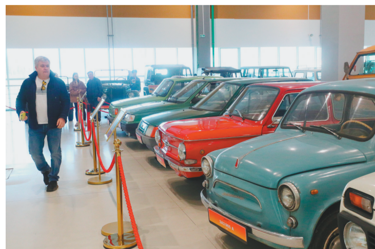
3月28日，人们参观白俄罗斯明斯克州的复古车展。当日，“汽车时代”复古车展在白俄罗斯明斯克州举办，展出来自不同年代的超过150辆汽车和200辆摩托车。