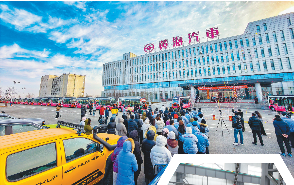
在丹东黄海新能源基地,22辆“甜莓V8”微循环纯电动公交车正式交付。

新兴产业的崛起为发展注入新动能。新能源、新材料等5个新兴产业投资增长10.7%,高技术制造业增加值占规模以上工业增加值比重达到13.2%,稳居全省首位。42个产品入选省工业创新产品,新东方晶体项