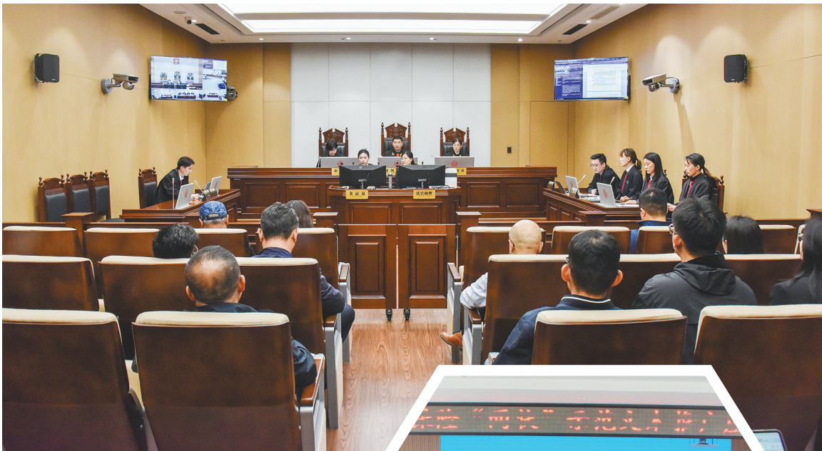
沈阳金融法庭“全国投资者保护宣传日”活动暨示范庭审现场。

值得一提的是,在专项整治中,全省法院坚持一案一策、精准施策,大力清理未结涉企案件。与此同时,通过强化提级执行、交叉执行等举措重拳整治执行不规范问题,并对存在