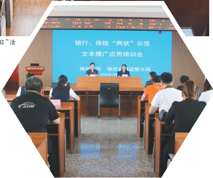
2025年7月,锦州中院联合锦州金融监管分局共同举办“两状”示范文本推广应用培训会,提升金融类案件诉讼文书质量,减轻当事人诉累。

信用是市场经济的基石,更是企业生存发展的核心竞争力,始终是企业高度关注的焦点。全省法院持续健全完善失信预警惩戒与信用修复激励双向机制,细化信用惩戒分级标准、规范适用流程,2025年共发布失信信息2.8万次,同时为3.05万户暂未履行能力但主动纠错、积极整改的企业和生产经营管理者办理信用修复,有效降低对企业商业信誉的负面影响,助力企业轻装上阵、重返市场。