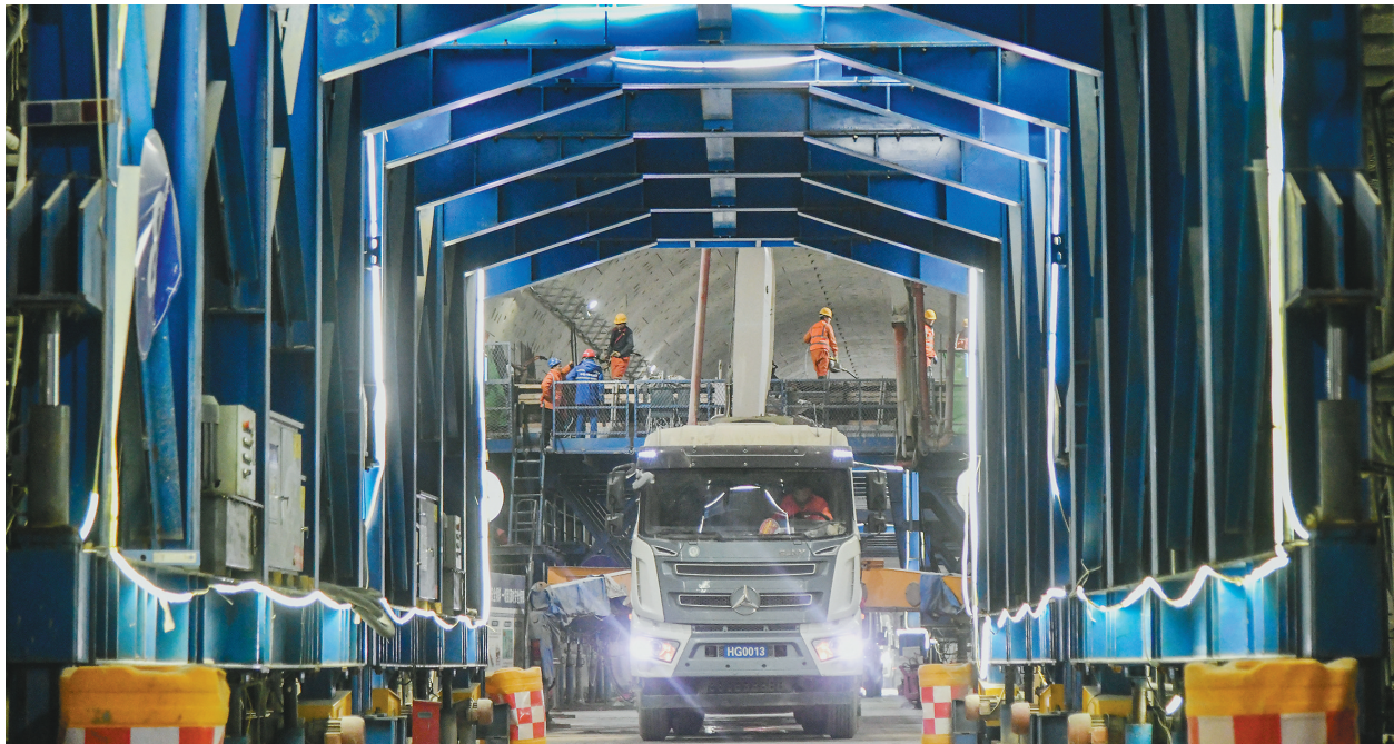
2026年1月1日，中铁十四局工程人员在山东省济南市黄岗路黄河隧道内施工。