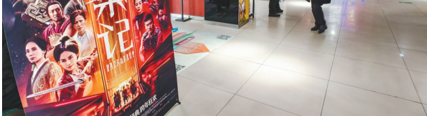
二〇二五年十二月三十一日在北京广安门电影院拍摄的一幅电影海报。

新华社北京1月1日电（记者邢拓）国家电影局1月1日发布数据，我国2025年电影总票房为518.32亿元，城市院线观影人次为12.38亿。其中，国产影片票房为412.93亿元，占比为79.67%。