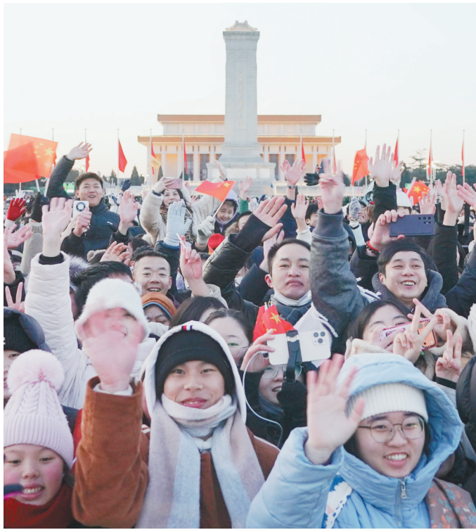
▲二〇二六年一月一日清晨，北京天安门广场举行隆重的升国旗仪式。