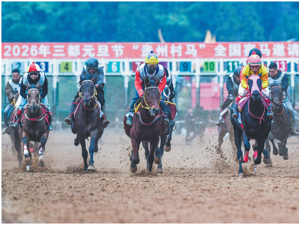
一月一日，二〇二六年「贵州村马」全国赛马邀请赛在三都水族自治县举行。图为选手们在比赛中。