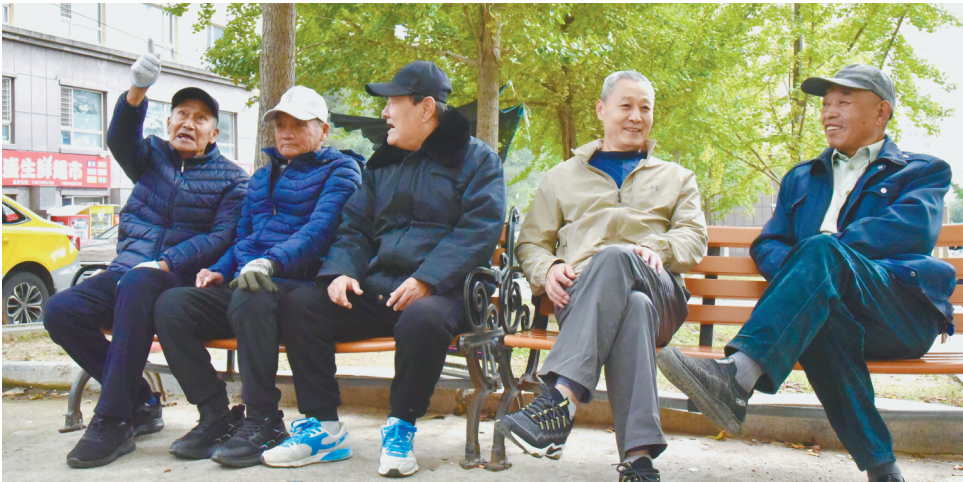
丹东的退休老人在社区爱心座椅上休息聊天，尽享舒适宜居生活。