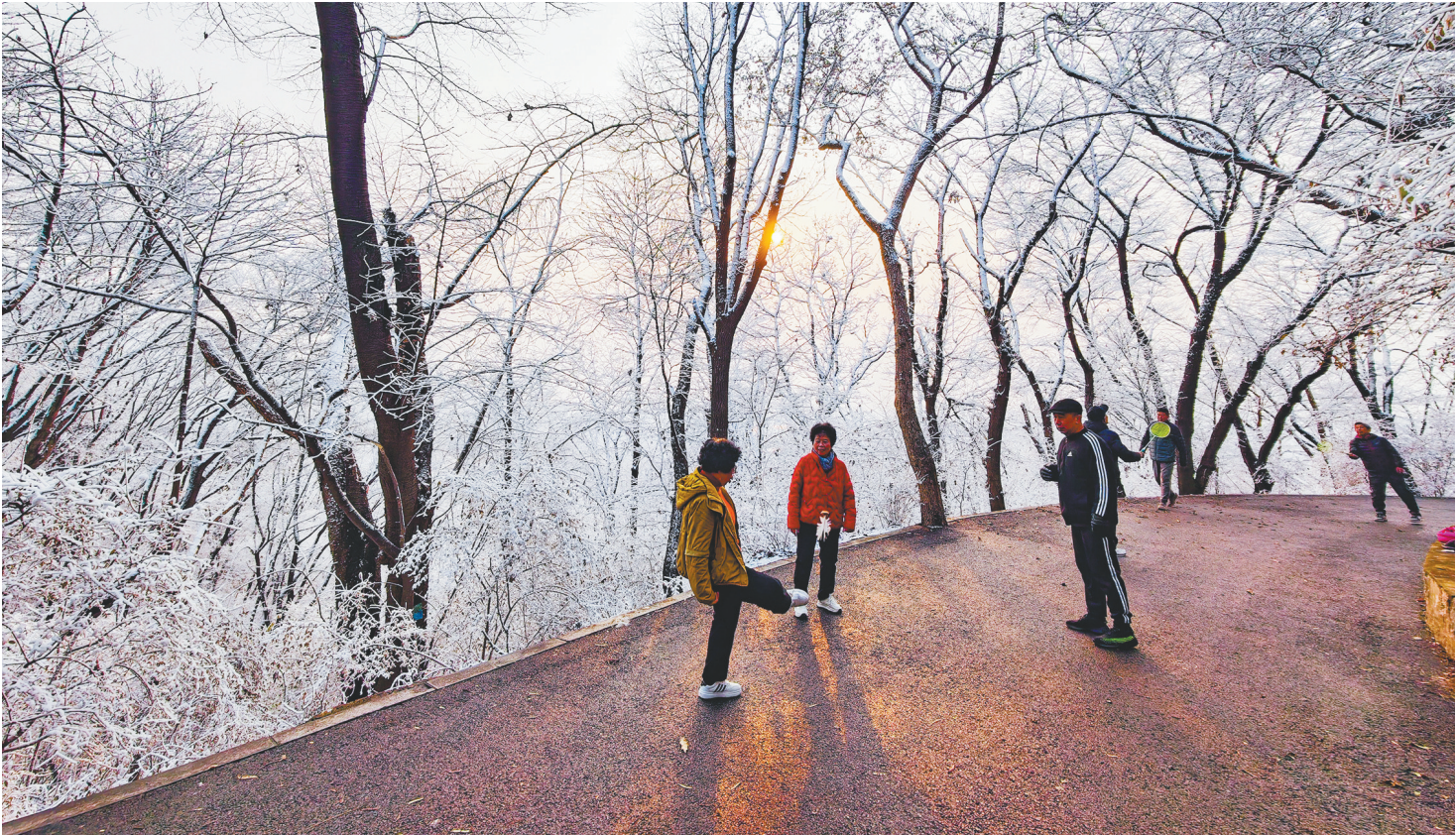
雪后清晨，丹东居民在美丽整洁的锦江山公园里游玩锻炼。

这样的暖心回应，基本每天都在丹东市发生。将12345热线作为联系群众最直接、最广泛、最快速的通道，今年以来，聚焦营商环境建设中的短板弱项，丹东紧盯“重点人、重点事、重点部位”，强化“组织保障、机制保障、力量保障”，以热线“小切口”构建责任闭环，撬动基层“大治理”。丹东市数据局数据显示：今年以来，12345热线已受理各类诉求38.25万件，办结率99.9%、满意率96.25%，每万人诉求量全省最低。这背后，是一条热线对民生的坚守，更是一座城市治理思维的体现。