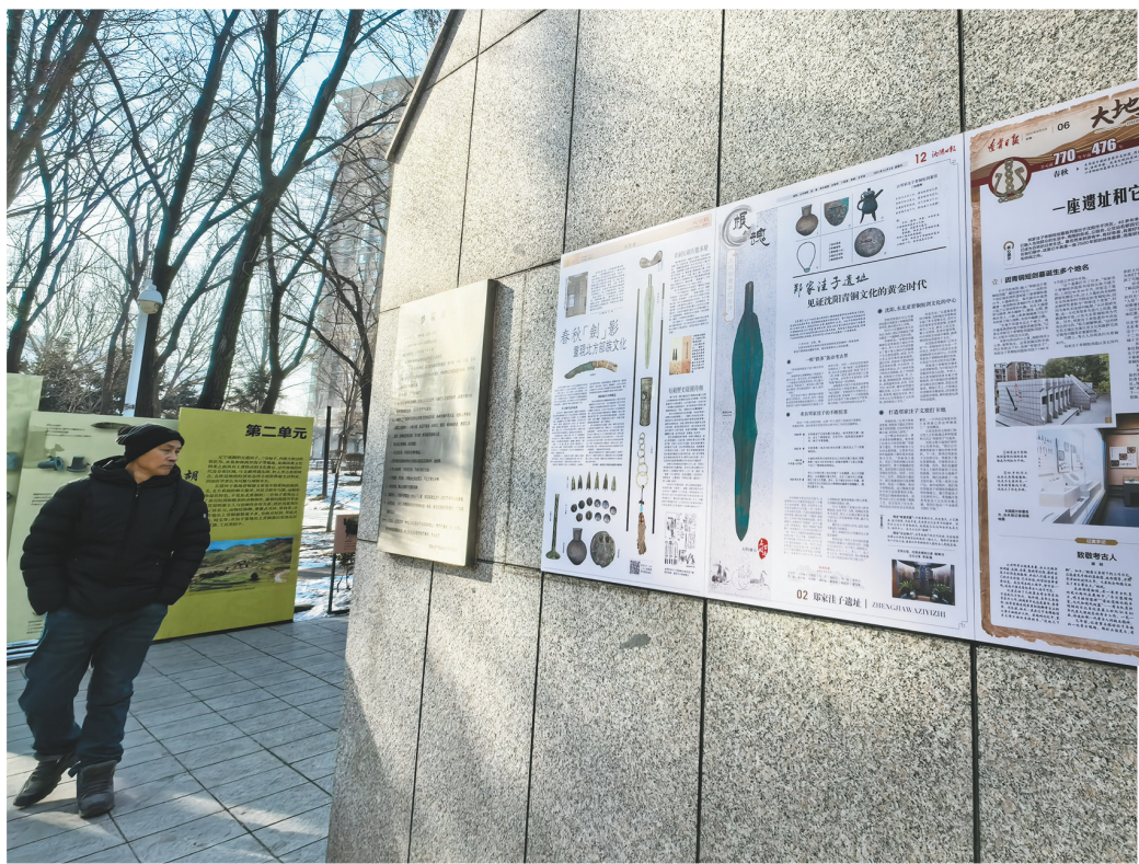
郑家洼子青铜短剑墓陈列馆外挂着本报的报样。

辽宁襟山带海的独特区位,孕育了多种文化交融的鲜活图景。从历史上看,数千年来,渔猎民族的灵动、游牧民族的豪迈、农耕民族的厚重在这片土地上碰撞、融合,刻下多元共生的文化基因,也让散落在田埂、山岗、村落间的不可移动文物具有了更加明显的“辽宁”印记。