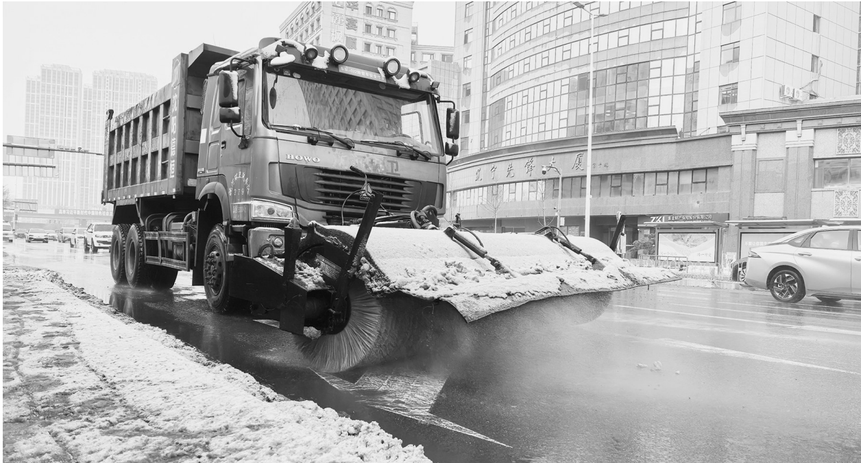
12月23日,沈阳市青年北大街上,除雪车积极作业,清除路面积雪。

省交投集团高速运营公司组建156个专业化除雪作业组,配备2145台多功能除雪机械,组织作业人员4700余名,并建立降雪动态监测与物资实时补给机制,确保物资储备量始终满足除雪作业需求。在除雪过程中,公