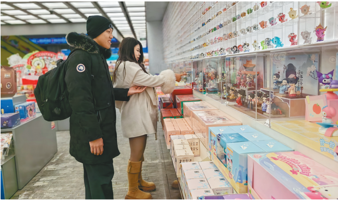
沈阳中街潮玩集合店里,年轻人挑选盲盒,乐在其中。