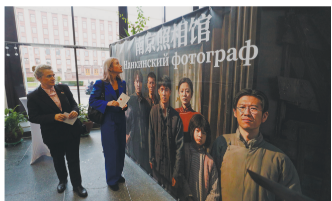
图为12月12日,在白俄罗斯明斯克,人们在中国电影《南京照相馆》海报前驻足。