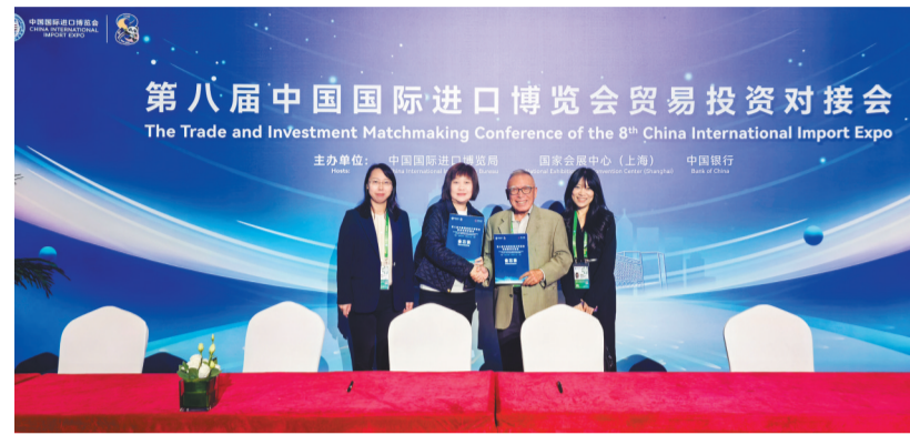
中国银行辽宁省分行连续八年为进博会提供全方位、多维度、深层次的综合金融服务,推动中外企业务实合作与共赢发展。

作为服务中国国际进口博览会的“全勤生”,中国银行辽宁省分行连续八年为辽宁地区客户提供全方位、专业化的进博专属金融服务,累计邀请410余户企业共赴“进博之约”,达成意向合作百余项,意向金额约10.1