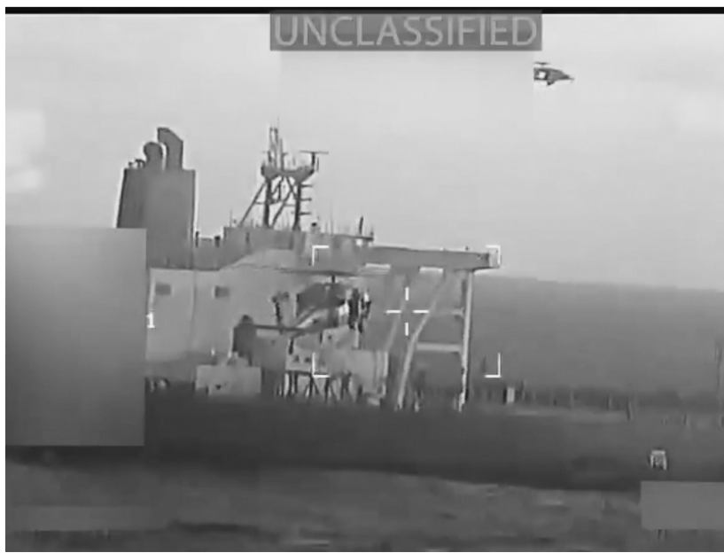
这张社交媒体视频截图显示,12月10日,美军扣押油轮。

近期,美国以“缉毒”为由,在委内瑞拉附近加勒比海海域部署多艘军舰,对委施压。特朗普11月底威胁可能“很快”通过陆路打击委内瑞拉“毒贩”。委内瑞拉多次指责美国意图通过军事威胁在委策动政权更迭,并在拉美军事扩张。