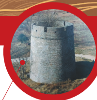
永安烽火台 位于普兰店区皮口街道新台子村