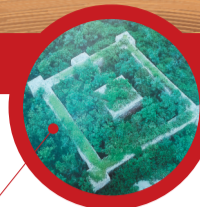
石河烽火台 位于金普新区石河村东台山顶上

元末至明中期约300年间,倭寇对我国辽南、东南沿海一带不间断地劫掠,形成倭患。从洪武二年(1369年)始,明朝派兵防御,剿杀倭寇,至嘉靖四十五年(1566年)倭患基本清除。大连市分布大量海防遗址,主要有——