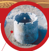
元台烽火台 位于瓦房店市元台镇后元村