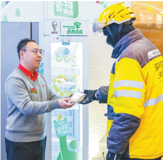
外卖骑手领取肯德基食物驿站余量食物。

五年来,肯德基打造了约1100家食物驿站,覆盖全国180余座城市,实现了“五年千店”的跨越式发展,构建起“减少浪费、社区关爱、低碳环保”三位一体的可持续公益模式。食物驿站已超越了单纯的食物分发点功能,逐渐演变成一个连接企业、社区、社会组织与居民的纽带,一个促进邻里互助、提升社区温度的平台。