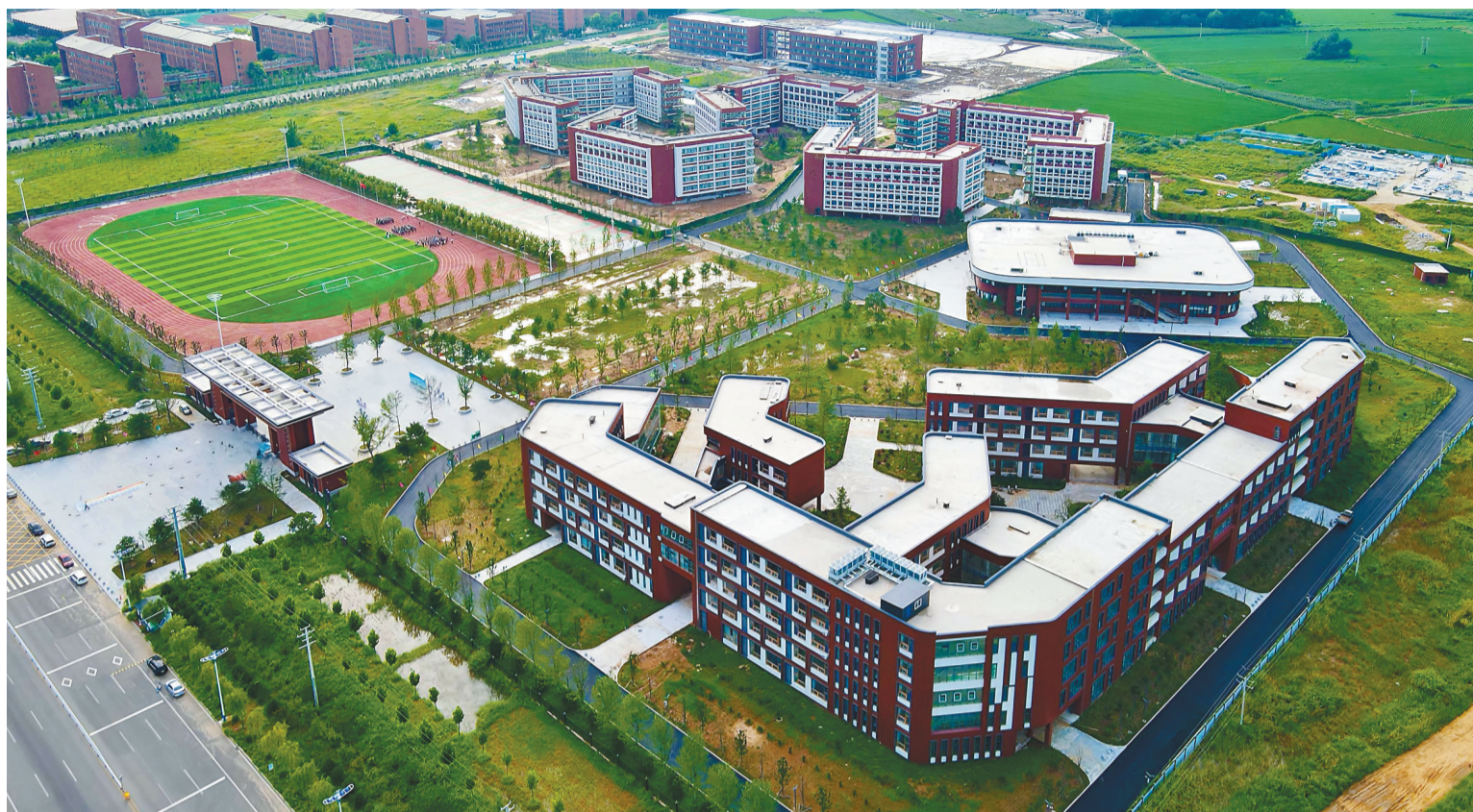
今年9月1日，辽宁东戴河志臻高中正式投入使用并开始招生。

如今的东戴河新区，恰似一名多元发展的“斜杠少年”，在文旅名片之外，不断增添兴新城、教育新城、宜居新城、科创新城、康养新城等城市标签。