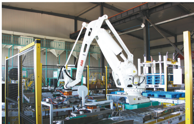
佳粮集团粮食深加工生产车间。