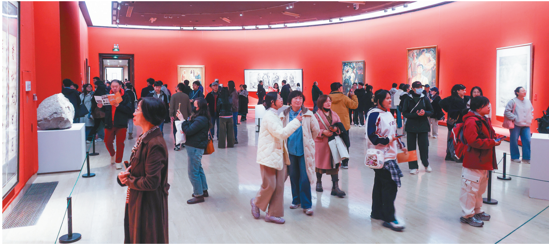
山海气象——辽宁美术书法精品展在中国美术馆展出期间,引来近3万名观众观展。图为展厅一角。

以山海气象——辽宁美术书法精品展为代表的高端精品展览,是辽宁美术书法工作者创作成果的一次集体展示,与辽宁文化夜校、百姓书法展等基层文化普及活动形成呼应,在高端示范与基座夯实的双向发力中,带动中青年群体积极参与,构建起“高端引领、基层扎根、中间衔接”的完整文化生态,为辽宁文化振兴注入持久动力。