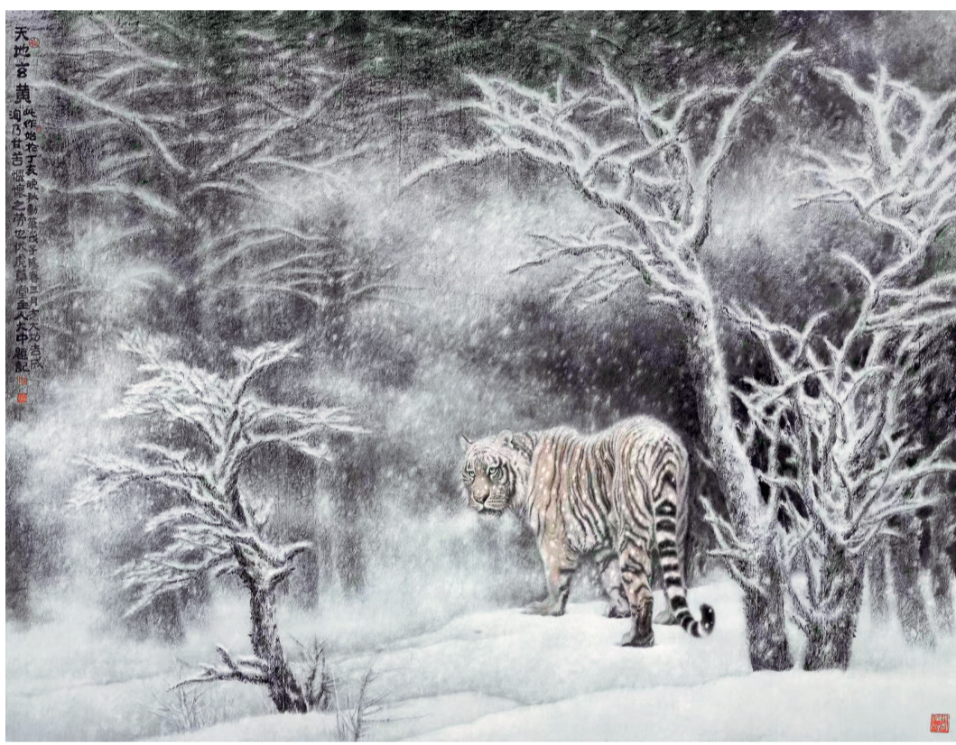
《天地玄黄》中国画 冯大中