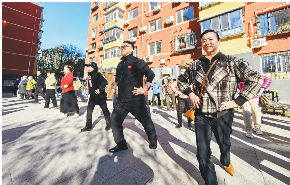
每周五天，志愿者带领沈阳市多福社区居民跳自创健身操。

沈阳市多福社区近四成居民是老年人，颈椎疼、关节僵是大家普遍都有“小烦恼”。在每周一次的“民情恳谈会”上，老人们道出心声：“广场舞节奏太快，跟不上还伤膝盖，能不能编排一套适合我们老年人的健身操？”居民的诉求，成了社区志愿服务的方向。