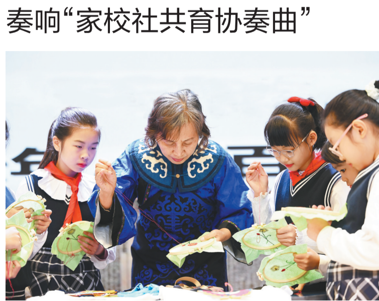
11月13日，沈阳市皇姑区宁山路未来校区“家校社”协同育人成果展暨家长开放日活动精彩启