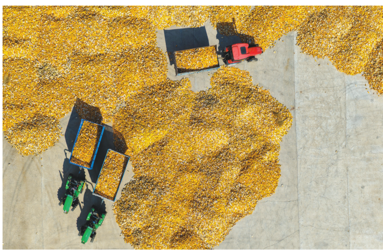
铁岭市昌图县大兴镇的运粮车往返穿梭,将新鲜收获的玉米及时运往仓储点。