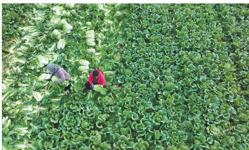
朝阳市双塔区桃花吐镇白腰村的田野上,村民们正忙着采收大白菜。