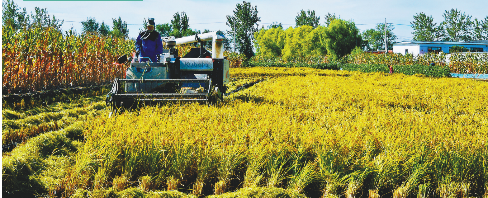
盘锦市的水稻陆续成熟,迎来收割季节。