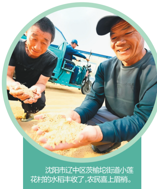
沈阳市辽中区茨榆坨街道小莲花村的水稻丰收了,农民喜上眉梢。