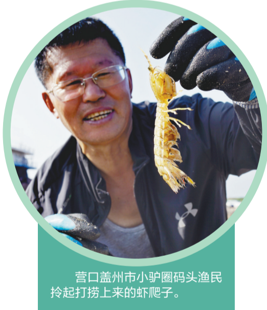
营口盖州市小驴圈码头渔民拎起打捞上来的虾爬子。