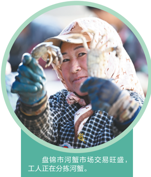
盘锦市河蟹市场交易旺盛,工人正在分拣河蟹。