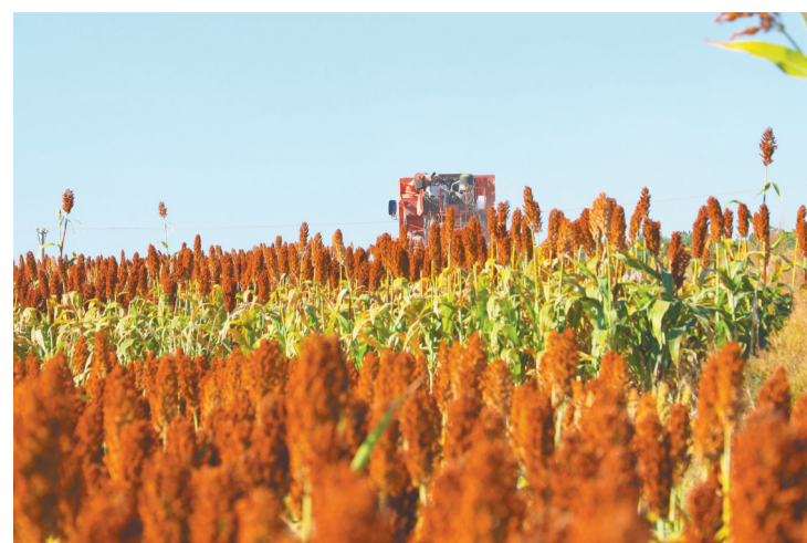
朝阳市建平县奎德素镇的高标准农田里,红彤彤的高粱穗迎风摇曳,沉甸甸的果实饱满诱人。