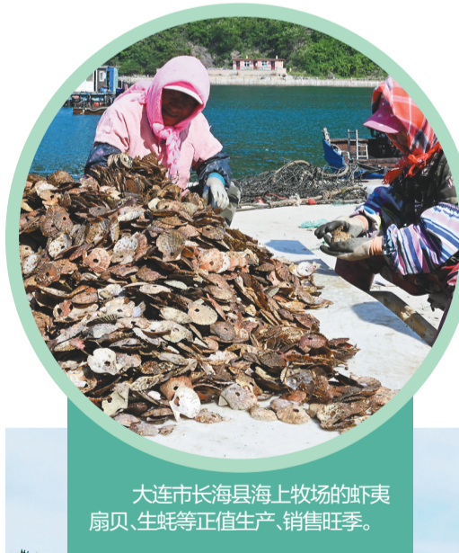
大连市长海县海上牧场的牡蛎、扇贝、生蚝等正值生产、销售旺季。