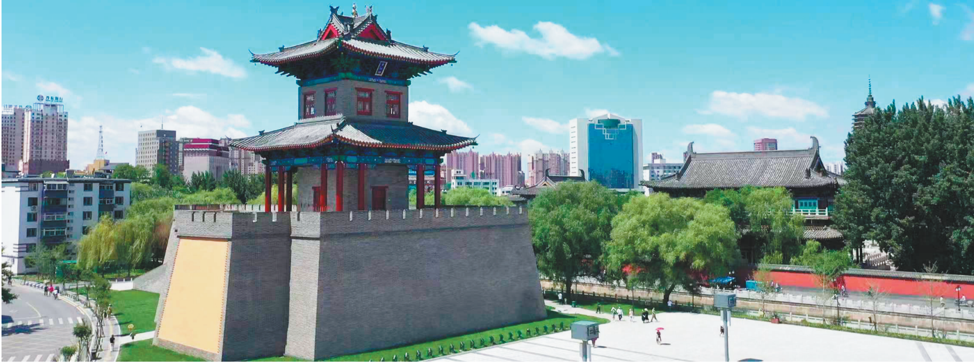
重建后的平胡楼,“城高厚壮,屹然雄峙”,尽显古城雄壮华美之风采。