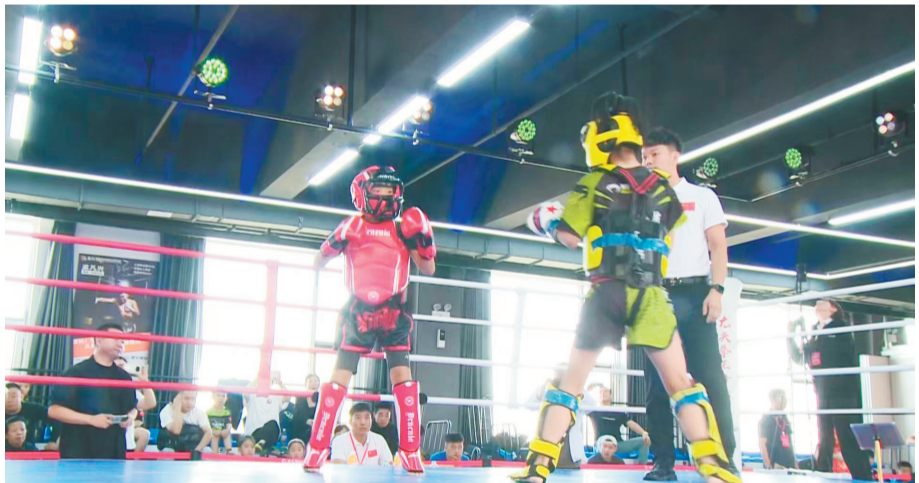
2025辽阳市第一届龙头拳王争霸赛吸引200余名外市选手参赛。