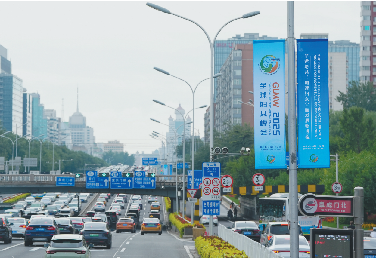
图为10月11日在北京街头拍摄的全球妇女峰会道旗。

‘标准面前无性别’的平等理念彰显中国妇女事业发展的核心逻辑,即通过制度保障创造公平竞争环境,这正是对《北京宣言》精神的具体实践。”