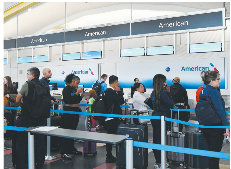
10月10日,在美国弗吉尼亚州阿灵顿的里根国家机场,人们办理值机手续。

在政府“关门”期间,所有空中交通管制员和机场安检员等提供“必要服务”的政府雇员必须“无薪”上班。据报道,美国联邦航空管理