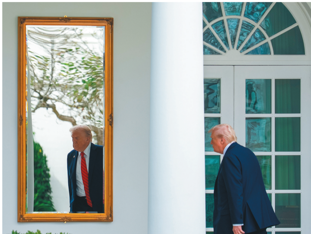
左图:10月10日,在美国首都华盛顿,美国总统特朗普返回白宫。 右图:10月10日,在美国首都华盛顿,美国总统特朗普准备乘直升机离开白宫。

10日,美国联邦政府“关门”进入第十天,白宫“大手一挥”,宣布开始大规模解雇联邦雇员。据美媒报道,超过4000名联邦雇员将丢掉工作。美国总统特朗普称,裁员将集中在“趋向民主党的领域”,会波及“很多人”。