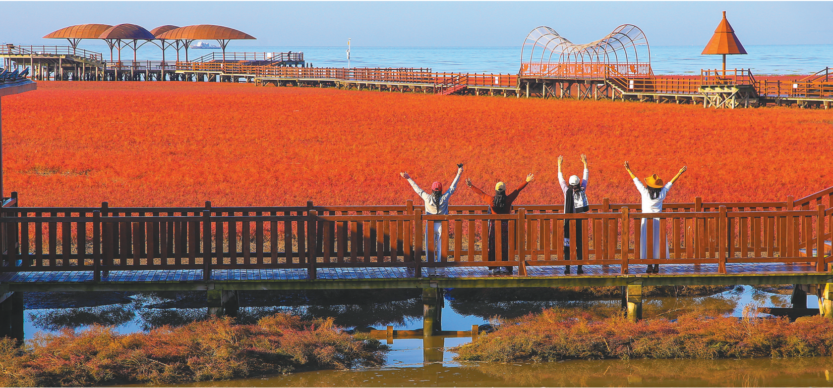
金秋时节，盘锦红海滩碱蓬草悄然铺展，这是一年中最美的季节，期待游客的到来。