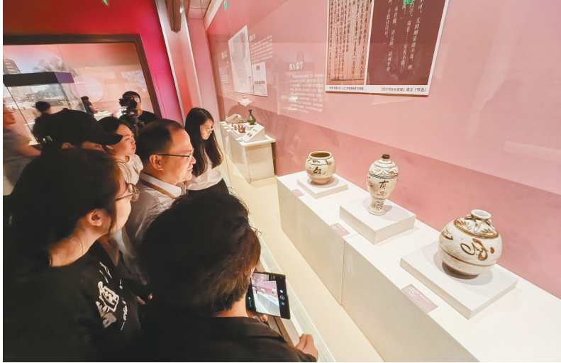
辽博“山海共融 和合共生”主题展今夏顶流,观众围观的不仅是文物,更是穿越千年的文化共鸣。