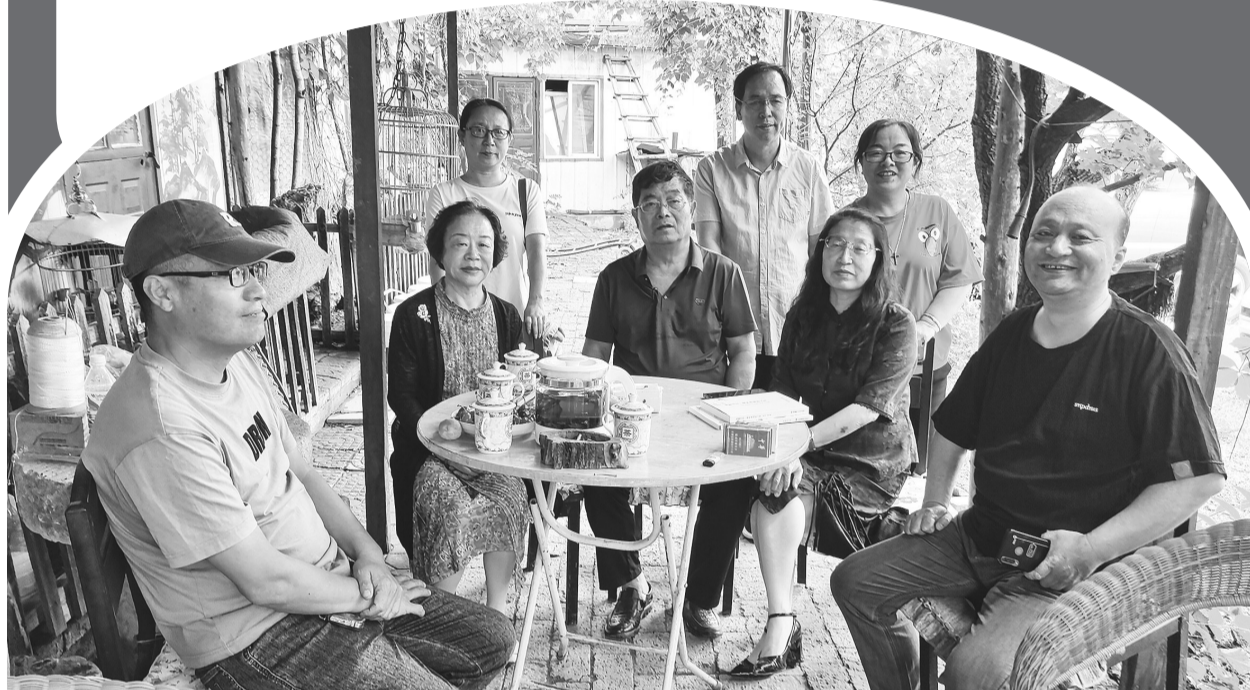
在农民作家家中开笔会是朝阳作家们的“家常便饭”。图为笔会现场。

为何在小凌河流域产生如此多的农民作家？他们如何“用双手耕耘土地”的同时，又用文学和艺术抒写对生活的热爱？如何比肩“西海固农民作家群”，将作品托举到全国舞台？小凌河的文脉又该如何延续？这次话题在研讨会上得到了深入的探讨。