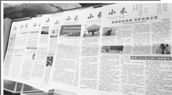
如今的《小禾》已出版了318期。