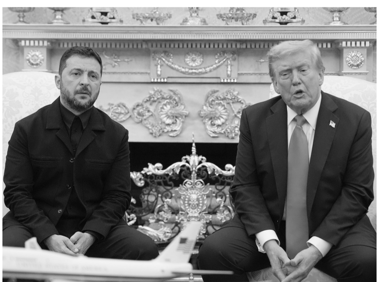
美国总统特朗普(右)在华盛顿白宫与乌克兰总统泽连斯基举行会晤。

据新华社华盛顿8月18日电(记者熊茂伶 黄强)美国总统特朗普18日在白宫与到访的乌克兰总统泽连斯基举行会晤后表示,下一步将筹备与俄罗斯总统普京的美俄乌三方领导人会晤,他期待取得好成绩。