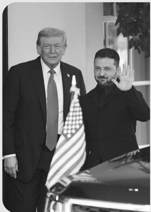
8月18日,美国总统特朗普(左)在华盛顿白宫迎接乌克兰总统泽连斯基。