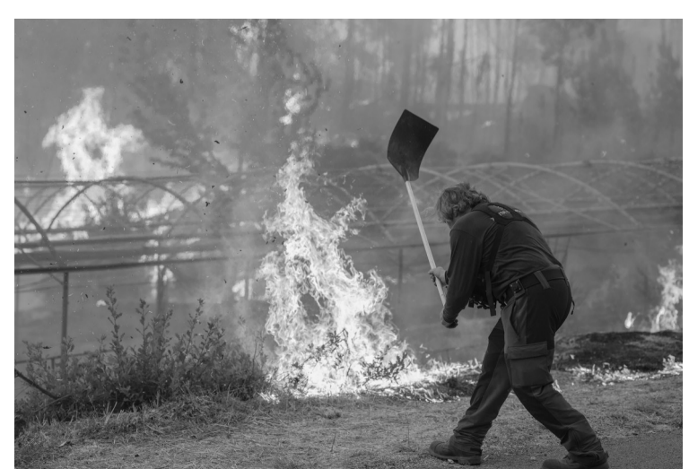
最新数据显示,今年以来,西班牙野火过火面积超过34.3万公顷,接近50万个足球场大小。图为8月17日,护林员在西班牙奥伦塞参与灭火作业。