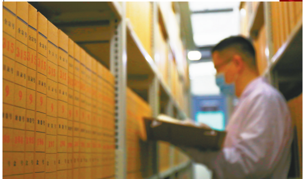
吉林省档案馆收藏了大量珍贵档案。