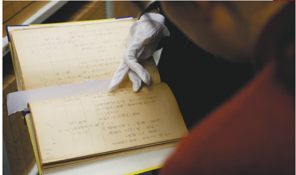
档案记录了杨靖宇殉国前100天的战斗历程。