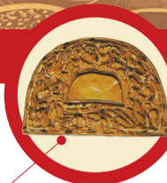
朝阳田草沟墓地半圆形金牌饰