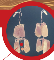
北票喇叭洞墓地金耳坠