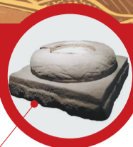
朝阳和龙宫遗址柱础石