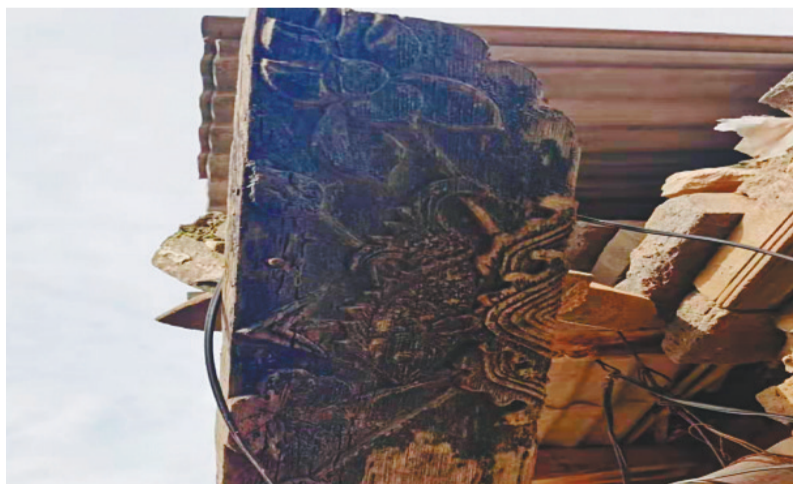
大连瓦房店市许屯村陈家大院百年古宅。