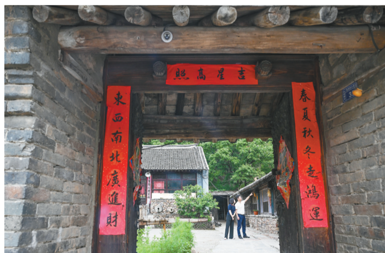
葫芦岛市绥中县永安堡乡西沟村一处传统民居院落。