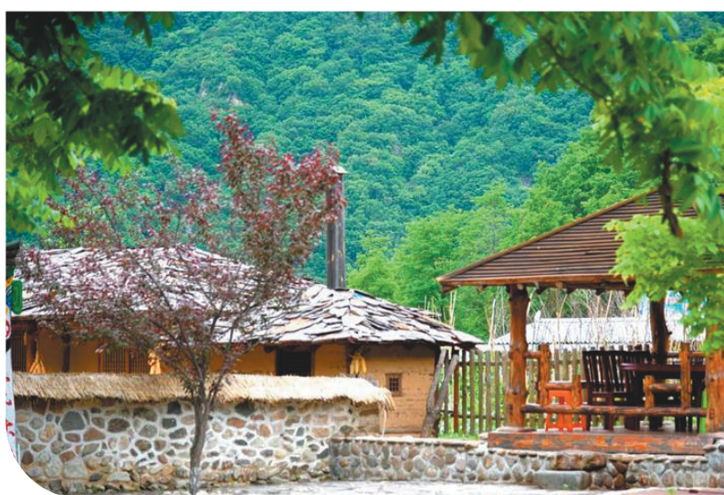
丹东市河口村民居。