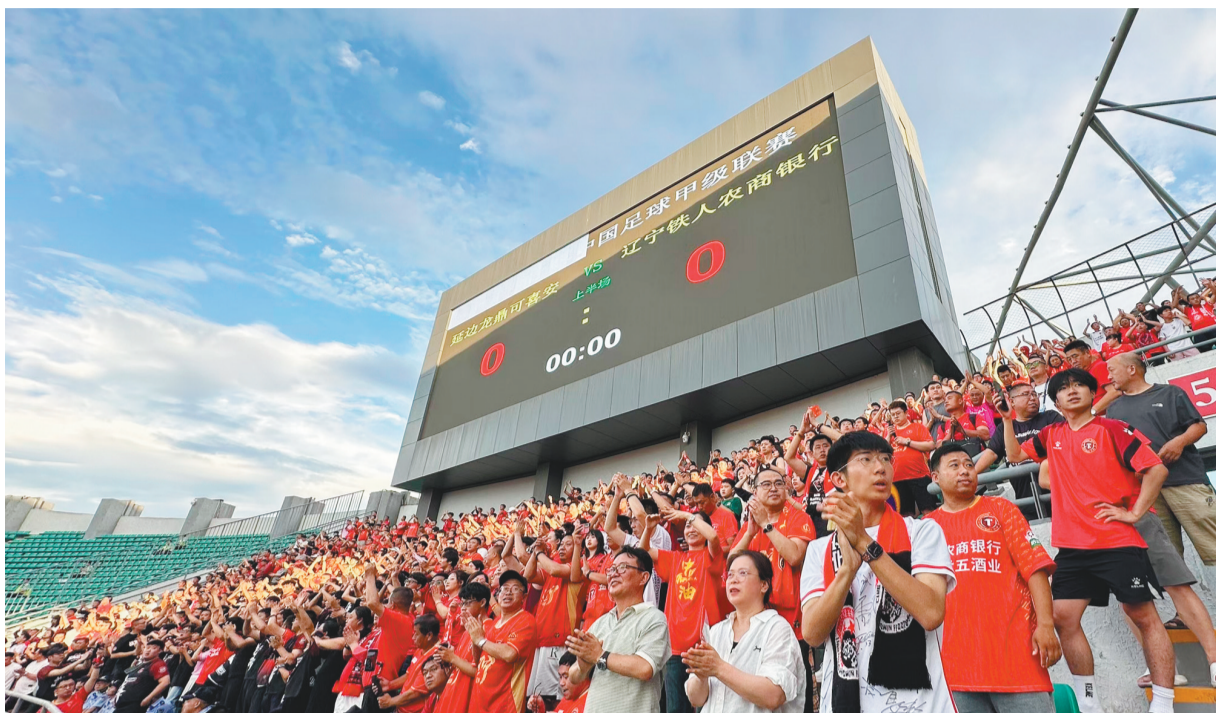
7月26日,辽宁铁人队球迷在延吉市人民体育场南看台上。

作为中甲第一名和第三名之间的较量,26日的比赛中,辽宁铁人队与延边龙鼎队在赛场上展开角逐,双方球迷各自为喜爱的球队助威,但总体上,这场“东北德比”的氛围非常和谐。据闫恩皓介绍,在开场前,延边球迷喊“欢迎辽宁球迷”,辽宁铁人队球迷则高声致谢。比赛结束后,虽然主队输掉了比赛,但延边球迷仍然很有气度地喊出“一起冲超”,向辽宁铁人队表达了祝福,并祝即将返程的辽宁铁人队球迷“一路顺风”。