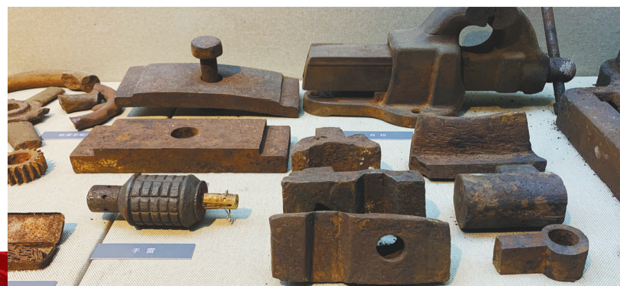
七星砬子兵工厂遗址出土的各类枪械修理和制造工具。