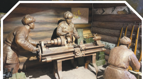
七星砬子兵工厂场景复原。