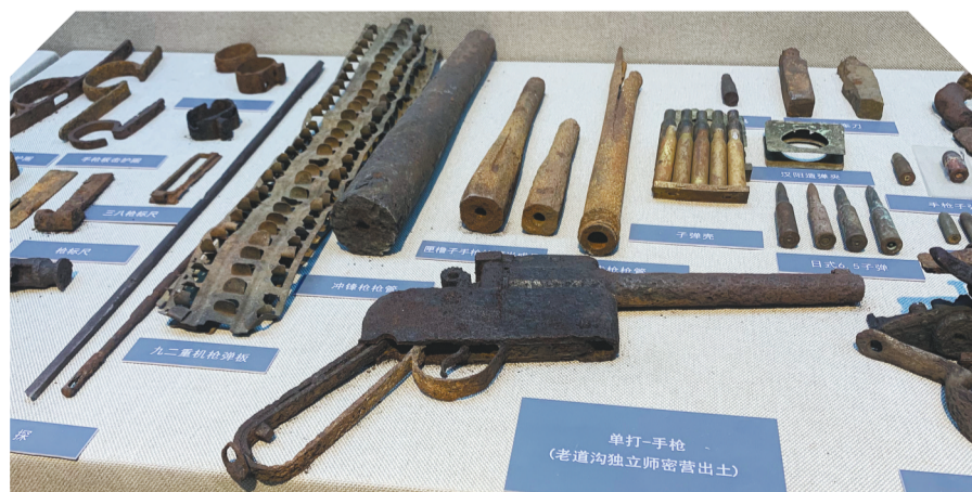
老道沟是七星砬子兵工厂的核心生产区，主要负责制造枪支和弹药。