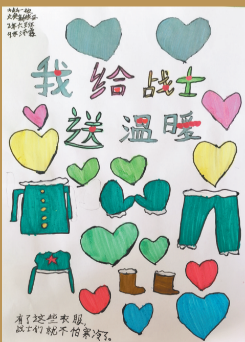
献给抗联英雄的“童”画。

这些纯真笔触在共同诉说：抗联英雄当年的牺牲与期盼，我们看见了；你们用生命守护的江山，我们稳稳接住了。孩子们以画作答，让抗联英雄听见新时代的回响：你们当年在冰天雪地中守护的梦想，已在今日沃土上开出最盛大的花。