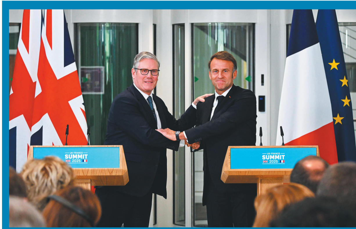
7月10日,英国首相斯塔默(左)与法国总统马克龙在英国伦敦郊外诺斯伍德军事基地举行联合记者会。

递出法英改善关系的明确信号,美欧关系的不确定性成为法英拉近关系、推动合作的重要考量。