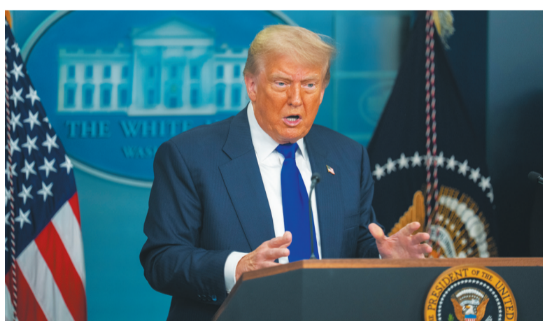
图为特朗普在华盛顿白宫出席记者会。

引消息人士说法报道,特朗普将在今年1月上任后首次动用“总统提用权”(PDA),从美军现有库存中提取价值3亿美元的武器弹药援助乌克兰,包括“爱国者”防空系统导弹、进攻型中程火箭等。具体装备会在10日举行的一次会议上敲定。