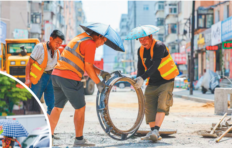
▲市政工人安装井盖。 本报特约记者 周广庆 摄 ▲汛期，丹东交警坚守一线，冒雨在城市主干道指挥交通。 本报特约记者 周广庆 摄

水一直成为良好生态环境的“标配”，最能凸显出丹东守护生态环境安全一张蓝图绘到底的恒心与恒劲。