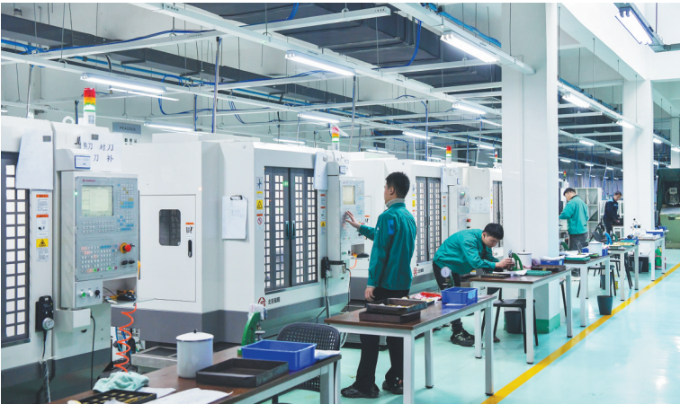
辽宁孔雀业生产车间。