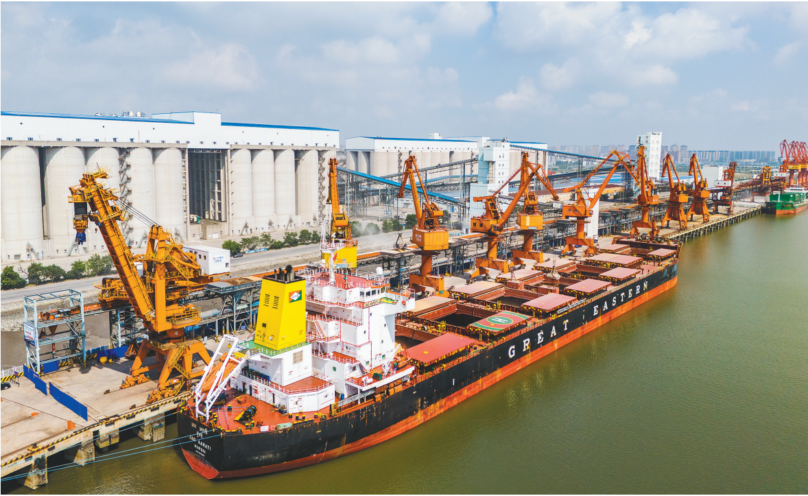
今年上半年，丹东港累计完成货物吞吐量1729.7万吨，同比增长22.6%。

良好生态环境是提升群众安全感的重要保障。以法之名守护绿水青山，护航生态文明建设，让蓝天碧