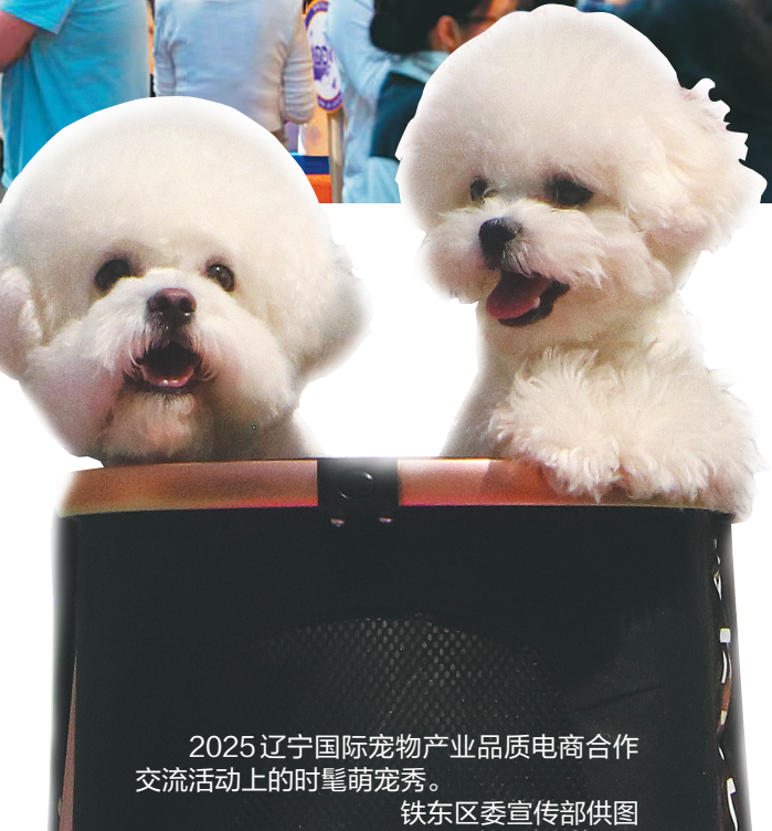
2025 辽宁国际宠物产业品质电商合作交流活动上的时髦萌宠秀。