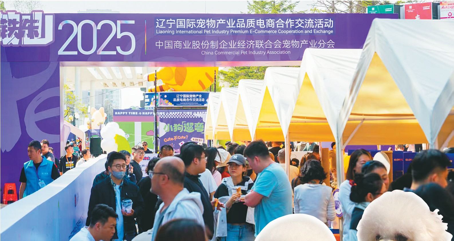
2025 辽宁国际宠物产业品质电商合作交流活动在鞍山举行。

面向未来,鞍山市锚定建设“中国萌宠之都”目标,计划打造全国领先的宠物繁育基地和全球宠物交易中心。通过政策扶持、品牌培育和市场拓展,进一步优化产业结构,提升产业附加值,推动宠物经济向高端化、智能化、国际化迈进。