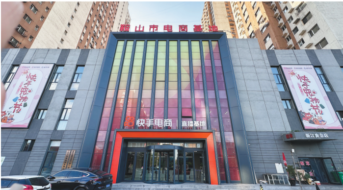
快手宠物电商直播基地。