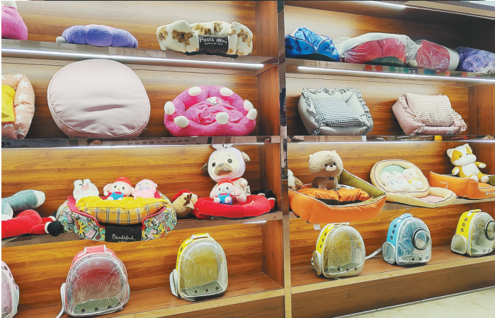
海城市宠物箱包类产品。