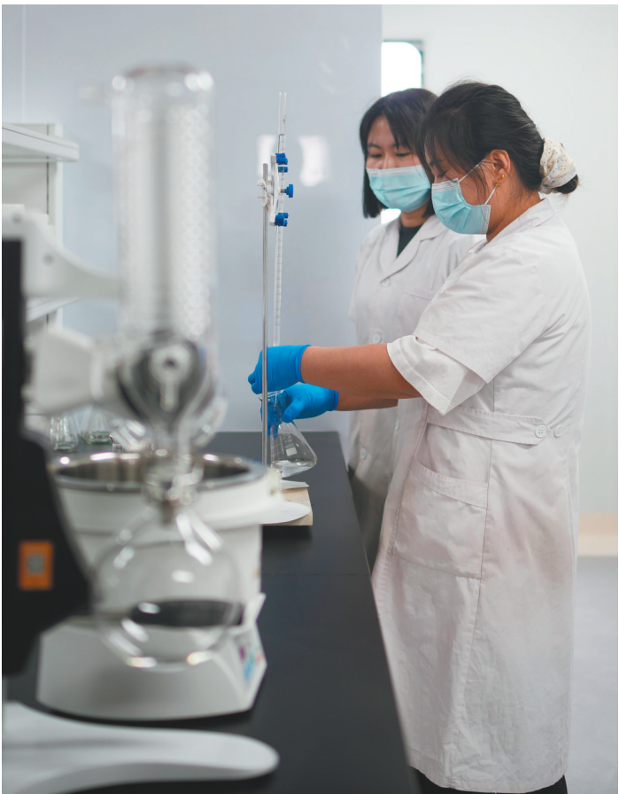
辽宁安九动物营养食品有限公司的宠物食品检验环节。