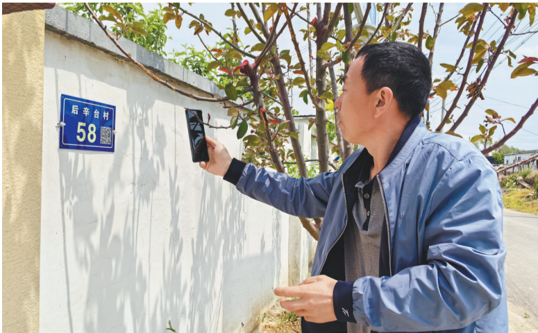
智慧门牌路牌让沈阳市于洪区后辛台村村民家一目了然。